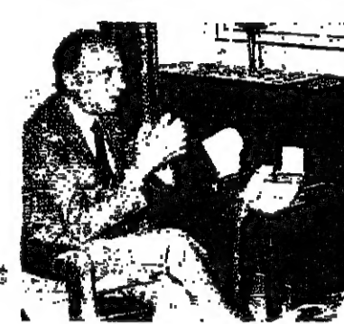
والامين العام الخارجية والناطق لومر

رأى نائب برلين عن الحزب الديمقراطي المسيحي، السيد هنري لومر ان مفتاح المشكلة اللبنانية هو الوجود السوري، واعتقد ان من المفيد ان تسال الشعب في لبنان اذا كان يريد السوريين ام لا. لان ذلك هو نوع من تقرير الوضع، واعتقد ان الطريقة افضل تكمن في اناحه الفرصة ايام اللبنانيين ليجل مشكلتهم بالنسبة وهذا مفهومي لتقرير الوضع والى من الامم المتحدة في ان تكون مسددة ليجاد حل للبنان.